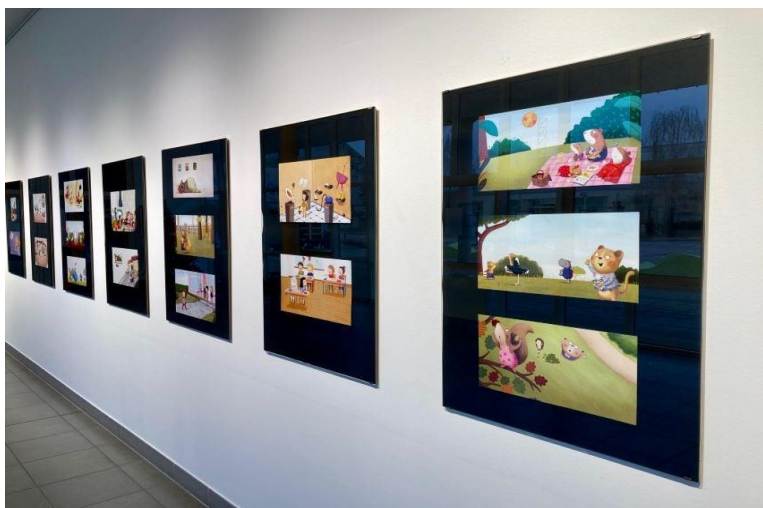
Izložba ilustracija Jelene Brezovec