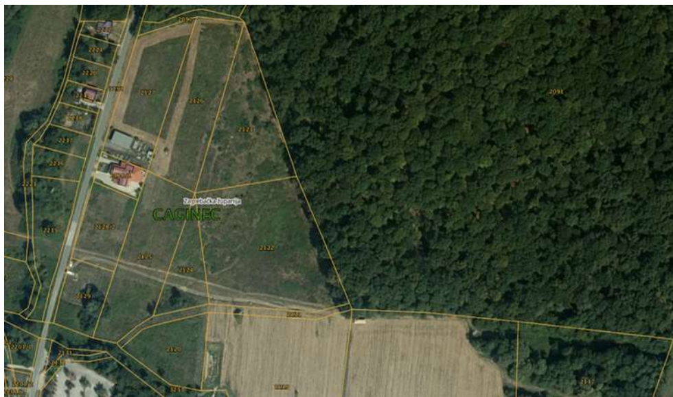
Prikaz katastarskih čestica u obuhvatu UPU na ortofoto podlozi DGU

Za navedeno u prethodnom stavku predviđa se formiranje više građevnih čestica koje bi osim diversifikacije sadržaja po namjenama omogućavale i faznu izgradnju kompleksa.