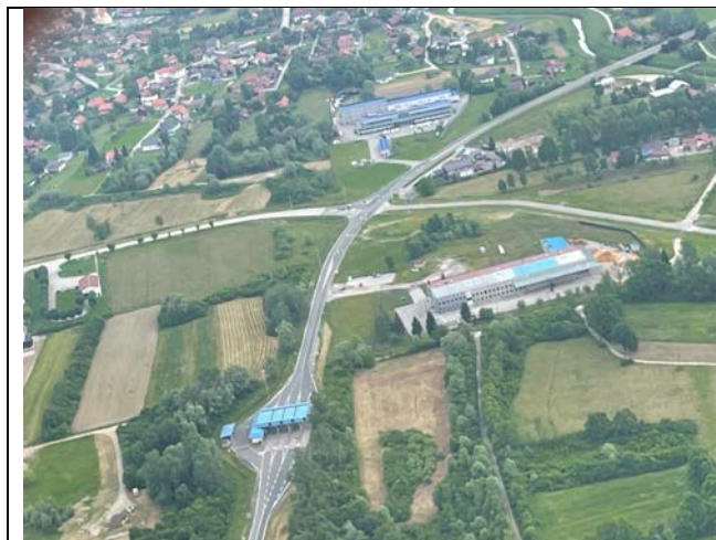
Sl. 01: Pogled na središnji dio obuhvata Plana te dio autoceste A3 do naplatnih kućica i dio državne ceste D43

Istočnim dijelom područja prolazi buduća obilaznica naselja Ivanić-Grad.