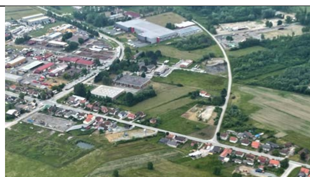
Sl. 04: Zgrade mješovitog načina korištenja u zapadnom dijelu, uz D43

Područje Plana je dobro prometno povezano sa Zagrebačkom županijom, ali i ostalim dijelovima Države. Južnim rubom obuhvata Plana prolazi autocesta A3 (GP Bregana – Zagreb – Slavonski Brod – čvorište Sredanci (A5) – Lipovac – GP Bajakovo), a uz sjeverni i zapadni rub državna cesta D43 (Đurđevac (D2) – Bjelovar – Čazma – Ivanić-Grad – Ježevo – Rugvica (A3/Ž3070)). Nadalje, ulaz na autocestu i prateće naplatne kućice nalaze se između dva područja obuhvata Plana .