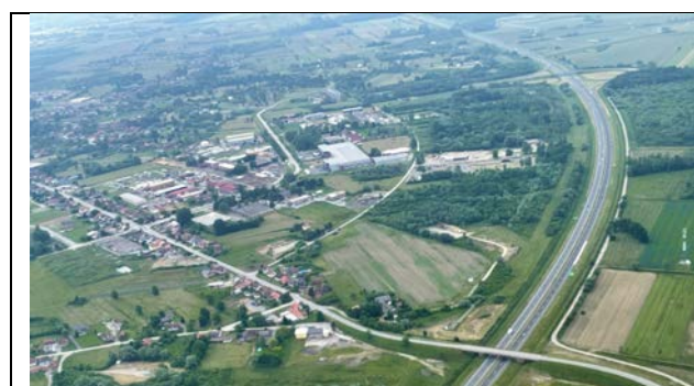
Sl. 03 Dio gospodarskog područja između autoceste A3 i državne ceste D43 (zapadni dio)