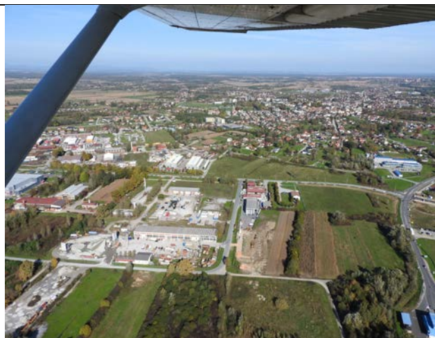
Sl. 02: Pogled na zapadni dio obuhvata Plana