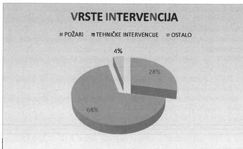
Slika 2. Grafički prikaz intervencija prema vrsti intervencija

Prema vrsti intervencija Javna vatrogasna postrojba intervenirala je na 70 požara, 171 događaja tehničke naravi, te na 10 ostalih događaja.